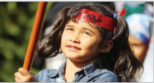
در حاشیه تجمع مادران و کودکان در حمایت از مادران و کودکان غزه