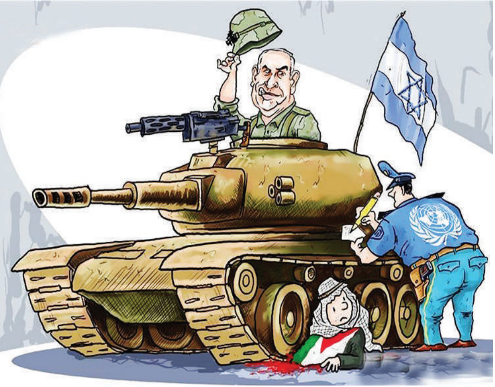
سکوت شرم‌آور غربی‌ها و سازمان ملل مقابل جنایات رژیم صهیونیستی