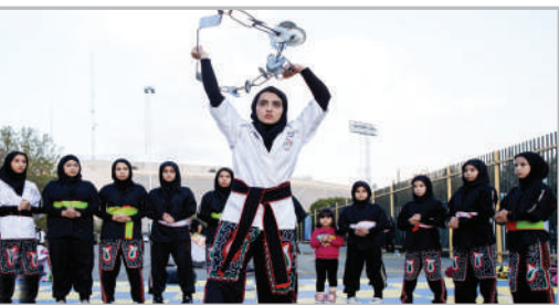
ویژه بر نامه «ماراتن شهری تهران»