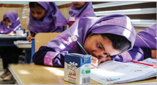
آغاز توزیع شیر در مدارس