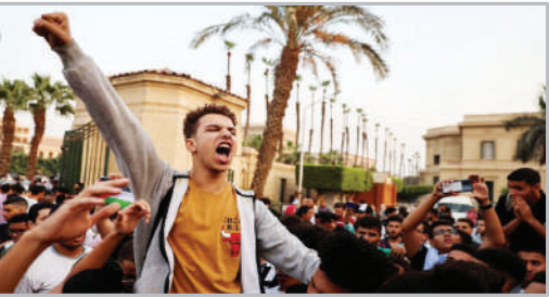
چرخش افکار عمومی جهانی بر ضد آمریکا و اسرائیل